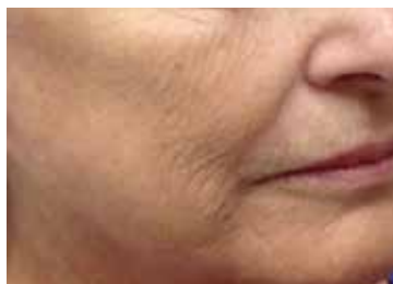
nach 4 Behandlungen

Eine professionelle Beratung und Behandlung erhalten Sie hier: