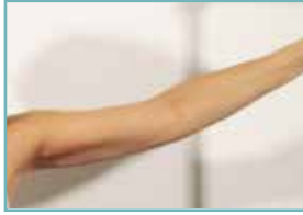
nach 6 Behandlungen